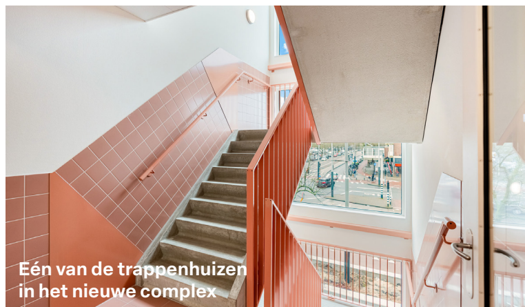
Eén van de trappenhuizen in het nieuwe complex